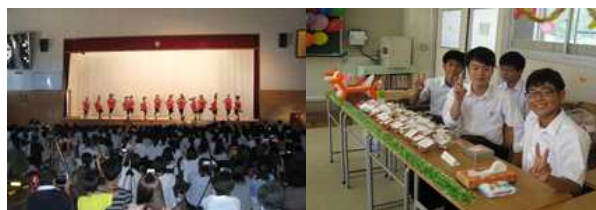
【六高祭（文化祭）の様子】