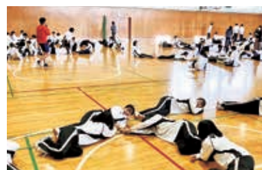
新入生オリエンテーション